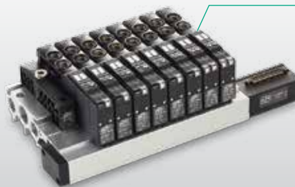
Elettrovalvole serie A2 Taglia: 1/4"